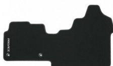
Dywaniki tekstylne (czarne) Dywaniki / Wykładziny