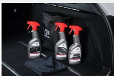
Zestaw kosmetyków samochodowych Toyoty Kosmetyki