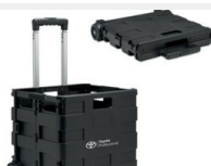
Skrzynka bagażowa Gadżety