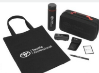
Zestaw prezentowy Professional Gadżety