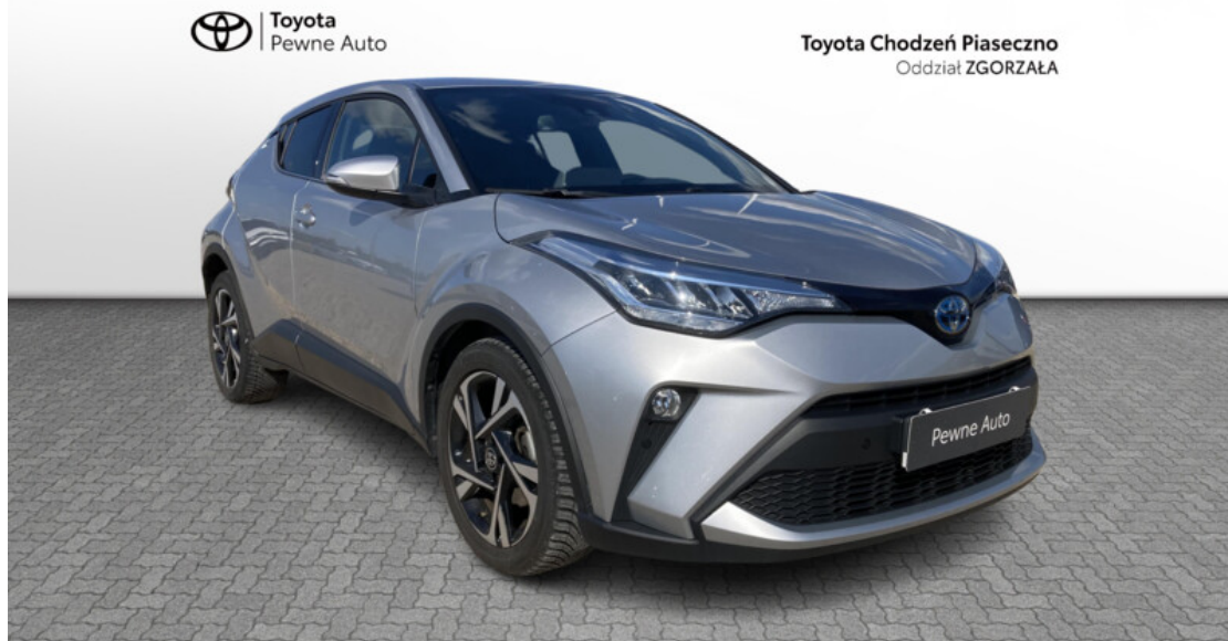
Toyota Chodzeń Piaseczno Oddział ZGORZAŁA